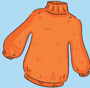
Een oude trui