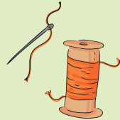
Naald en draad